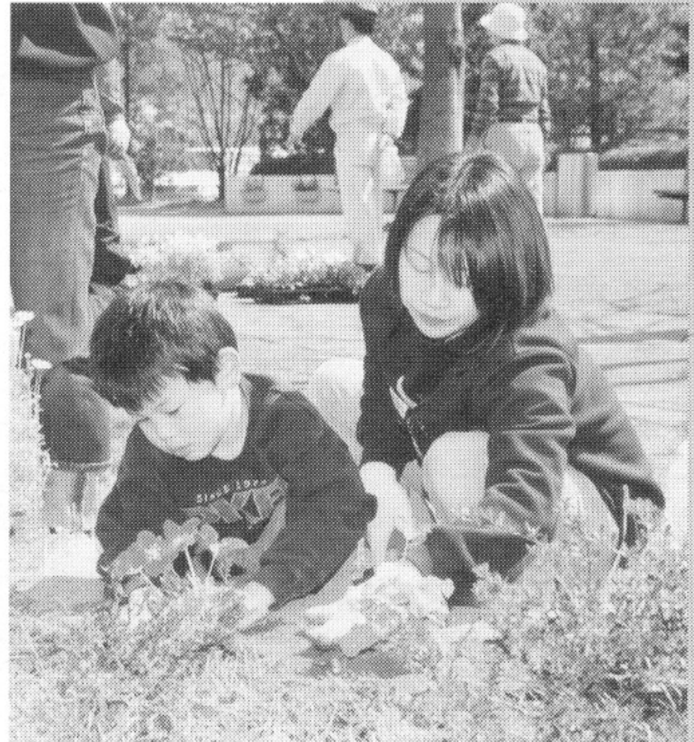
ボランティアによる花だん整備

競技の結果は、十日町分館が優勝。準優勝は高根町分館、3位が大原町分館でした。 4月29日 写真はアベックリレー