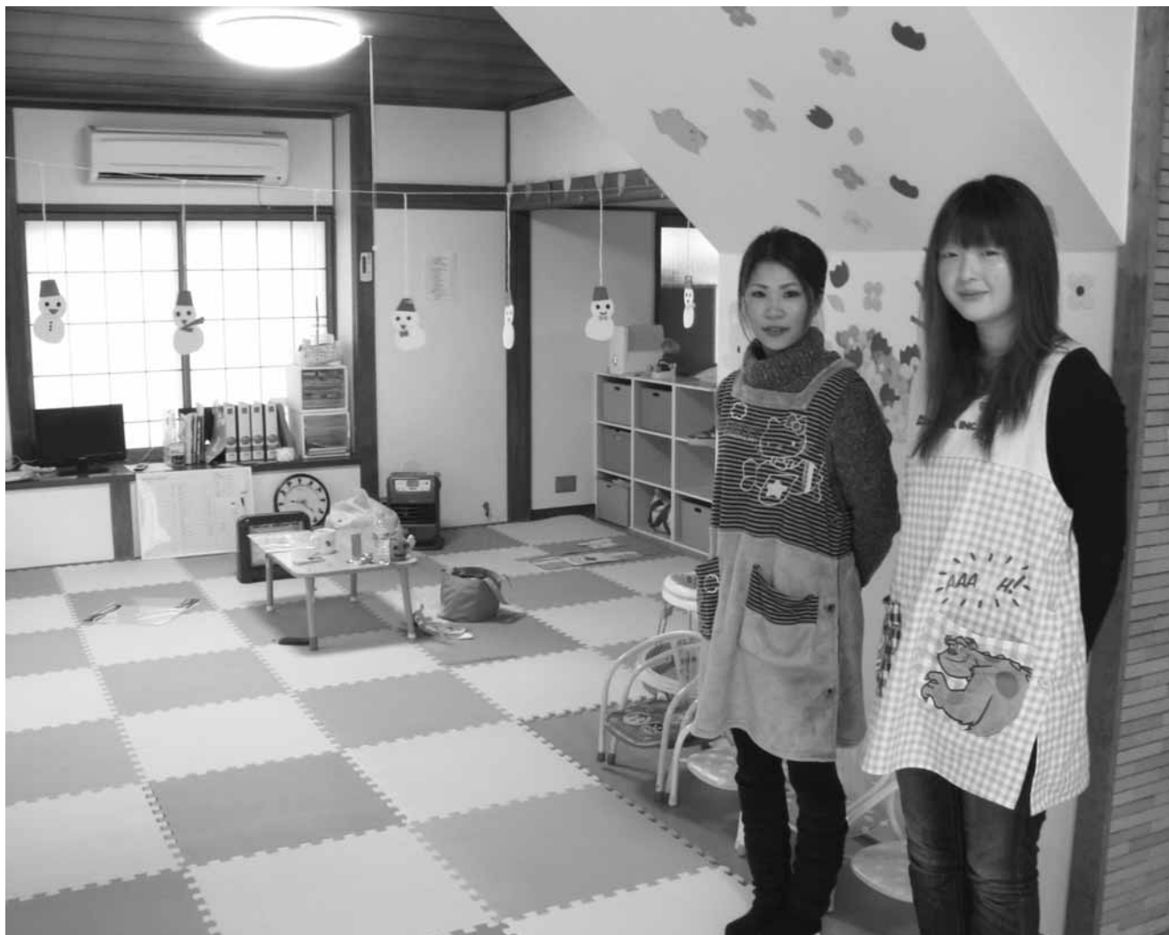
平成24年2月より開設した市立大町総合病院附属託児所「きらり」(関連記事：6ページ)

〒398-0002 長野県大町市大町3130 市立大町総合病院 電話 0261-22-0415 発行：市立大町総合病院広報委員会