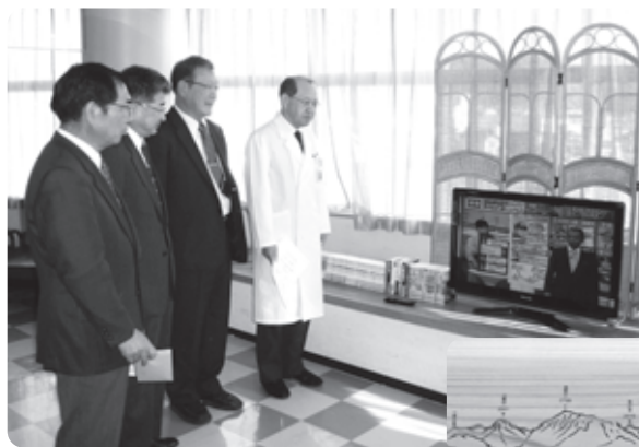
▼テーブルには北アルプスの焼印