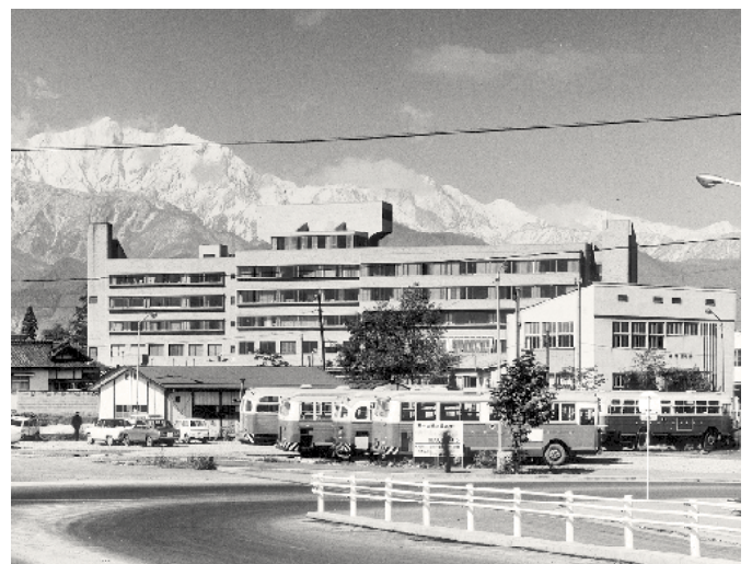
完成した新病院。バイパスは開通していない。 (昭和46年9月)