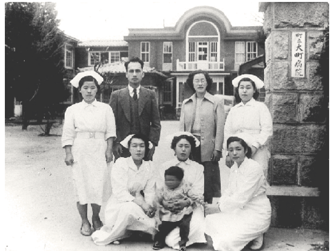
名古屋に戻る医師家族と別れの写真 (昭和25年)