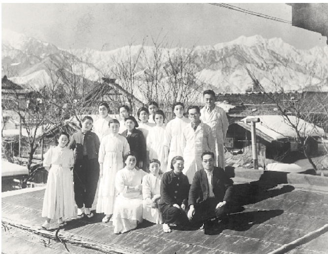
病院の屋根の上での記念写真 (昭和19年2月)