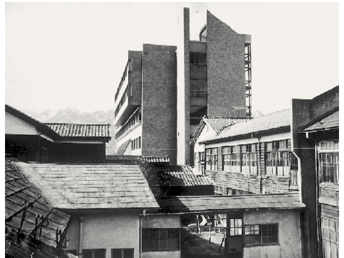
新しい病院と木造の古い病院(手前)