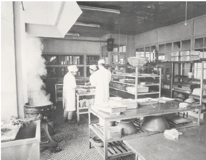
旧病院内の給食調理室