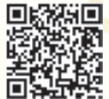
内藤いづみHP QRコード