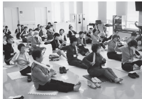
前回開催時の様子