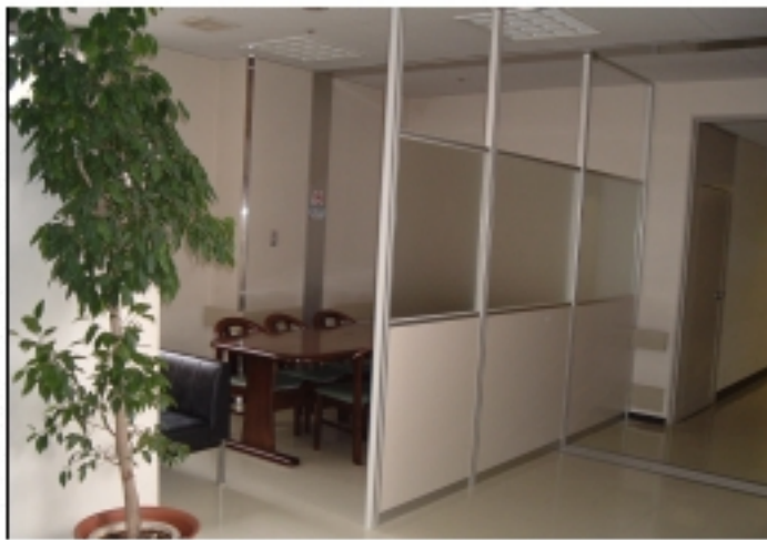
▶廊下との間にパネルを設置した手術室前の家族控室

案内表示は、外来2ヶ所、エレベーター前、検査室・放射線室前に、大きな文字で見やすい案内板を設置しました。(事務長)