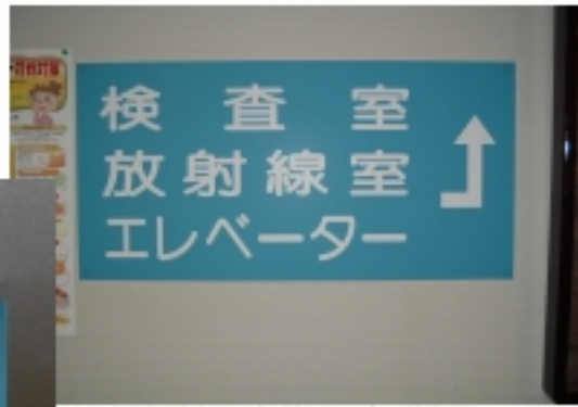
◀▲大きな文字の案内板