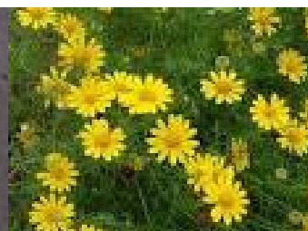
ダールベルグデージー