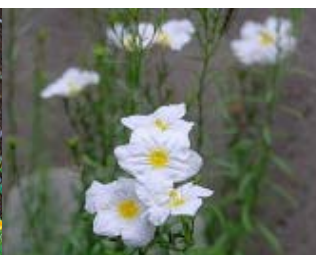
ニーレンベルギア