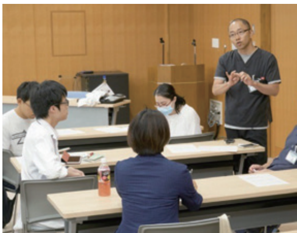
研修医カンファレンスの様子