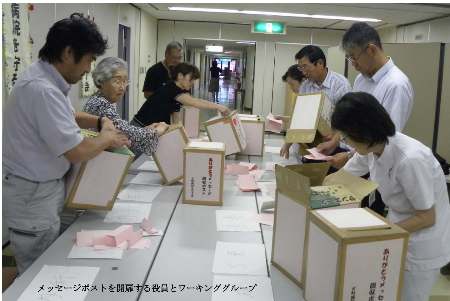
メッセージポストを開扉する役員とワーキンググループ

8月6日、午後6時半から「ありがとうメッセージポスト」の設置以来、第3回目の開扉作業が行われた。病院内に設置されたメッセージポスト約20個を回収し開扉、整理区分けした。今回の開扉はワーキンググループと四役、10人あまりで行われ、ワーキンググループが分担してパソコン入力した。メッセージはロビーなどに掲示された後、それぞれの皆さんに手渡される。投函されたメッセージは約70通で、提案・要望事項は病院へ直接手渡し、既にその対策が職場に指示されている。以下寄せられたメッセージをそのままお伝えします。