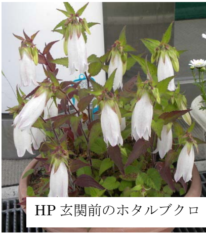
HP 玄関前のホタルブクロ

♥職員の皆様へ 毎日のお仕事ご苦労さまです。昨年度の病院経営は赤字から 18年ぶりに黒字転換したとのことおめでとございます。ごくろうさまでした。