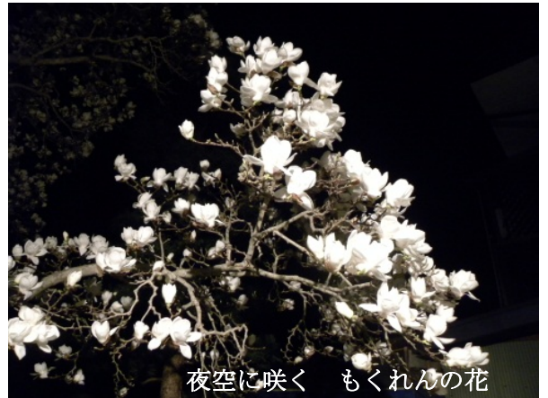
夜空に咲く もくれんの花

掛けて頂き、退院後も困らないよう指導して頂き本当に感謝しています。経産婦ですが、忘れてしまったことや知らなかったことが沢山あり、特に母乳(授乳)指導は分かりやすく教えて頂いたので、退院後自信を持って進めていけそうです。皆様お体に気を付けてこれからもママ達の優しく心強い味方でいてください。産後外来等またお世話になりますがよろしくお祈いします。(M・E)