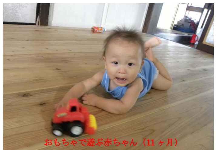
おもちゃで遊ぶ赤ちゃん(11ヶ月)