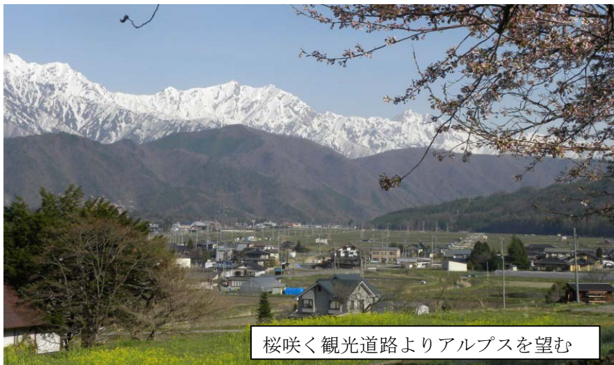
桜咲く観光道路よりアルプスを望む

♥先生には父親が大変お世話になっております。誠にありがとうございます。熱心で誠実な姿勢に感謝の気持ちで一杯です。しかし先生、私は先生の健康のことの方が心配です。重要な職責故、御健康最優先でお願いします。健康でいていただけるだけで安心なのです。父親ももう15年健康で過ごしています。(匿名ですみません)