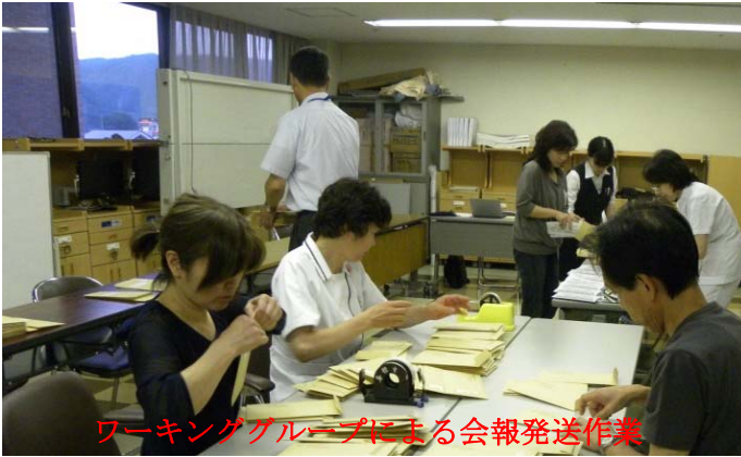
ワーキンググループによる会報発送作業