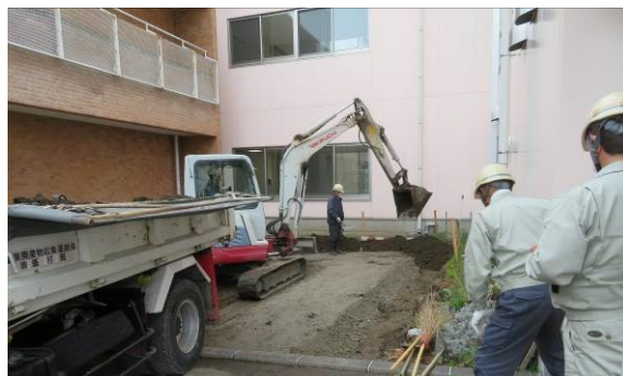
工事が進むミニ菜園・花壇

結成12年目の取り組みは全国的な新型コロナウイルス、オミクロン株の感染拡大のため、大幅な自粛・抑制を余儀なくされた。3密を避けるため総会は二度目の書面決議により実施された。議案ははがきによる採決により報告、事業計画など賛成多数ですべての議案が可決、決定された。