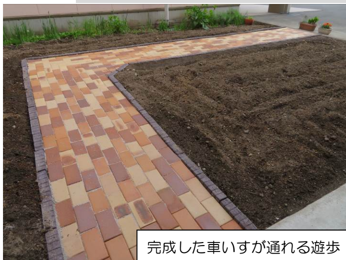
完成した車いすが通れる遊歩