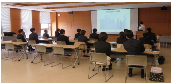
新採用職員ガイダンス

信州大学医学部の研修生が3回にわたり来院、コロナの間隙を縫って大町市の自然、歴史、地理、産業と病院の歴史、サポーターの会活動紹介などをした。カボチャ、玉ねぎ、ジャガイモ、白菜、大根、ラベンダー、栗、干し柿など野菜類と赤飯、白米を中心に医局他へ差し入れた。病院経営では職員が一丸となり改善を進め、令和2年度決算は、昨年度を上回る5億円余の経常利益を計上し、資金不足比率は解消し3年連続の黒字経営を実現した。またコロナ患者の入院治療、発熱外来や外来・検査センターの運営、さらにワクチン接種など、感染症指定医療機関としての責務を果たすべく努力された。年度末には外来ロビーの椅子と窓口カウンターのリニューアルが行われ院内が明るくなった。3年度末常勤医師は25人。