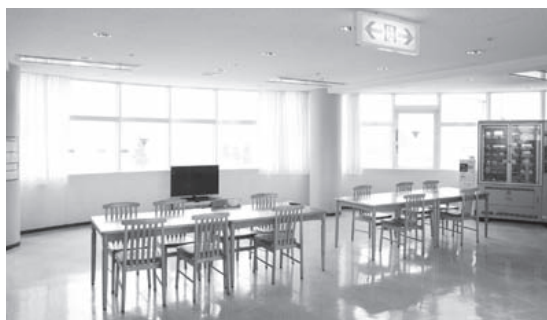
フリー Wi-Fiを設置した「4階ラウンジ」

A フリー Wi-Fiの利用につきましては、以前から要望があり、6月より4階ラウンジと南棟レストラン前に機器を設置して運用を始めました。今後につきましては、利用できる場所の増加に向け、機器の増設等を検討してまいります。