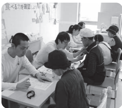
摂食嚥下チームによる活動 （病院祭より）

A 現在、地域の皆さまの「食べる幸せを守る」取り組みとして、地元の各種医療団体・大北歯科医師会・信州大学医学部と連携し、「口腔と食機能支援推進研究会」（食生活研究会）にも参加しています。お口を通して、地域の皆さまの生活に貢献できるよう、私たちも「みんなの食を守る守り隊」として研鑽していきます。ご理解・ご協力の程よろしくお願いいたします。