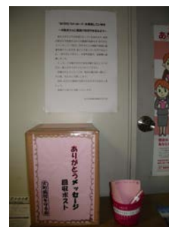
置かれたメッセージ箱

♡先生方、看護師さんだけでなく美味しい(大北・安曇野で1番)食事を作ってくださる厨房の皆さんそして部屋をきれいにしてくださっている皆さん、薬剤師さん、いつも迷惑をおかけしている医事系の皆さん検査技師の皆さん本当に感謝。