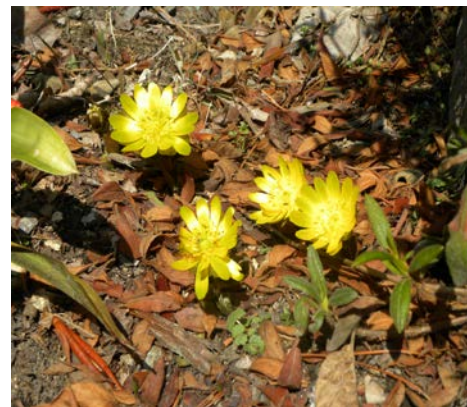
咲き始めた福寿草

♡吉田 Dr5階東のスタッフの方々、見えないところで食事を作りおそうじをしてくださっていた皆様、ありがとうございます!!ありがとうございました。私は治療がすすみ病の苦痛と点滴の管から開放された後、5階東の病室に窓からみえる、残雪の山々、雲の流れをゆっくり楽しみながら、皆さんに支えられつつ、ゆったりとした気持ちで体を休め、治療と看護をうけることができましたこと幸せな休息の時でした。私の人生の中で又とないすてきな時間でした。吉田 Dr 看護師の方々薬剤師の方から十分な説明を受け、やさしい言葉がけ看護を受けての入院生活でした。改めてありがとうございました。皆さんの一所懸命な日々の働きによって、大町病院がこの大北の地の人々に愛され、たよりになる病院になっていく事を願っています。皆様のご健康が守られますこと、お祈りいたしております。71歳 女性