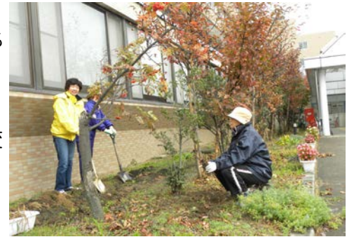
↑七かまど、紅葉の中での植栽作業

♥いつも 1 人だけ休みもとれず働いて家事のことも毎日父さんたちの面倒を見てくれて本当にありがとうございます。兄さんへ 妹より