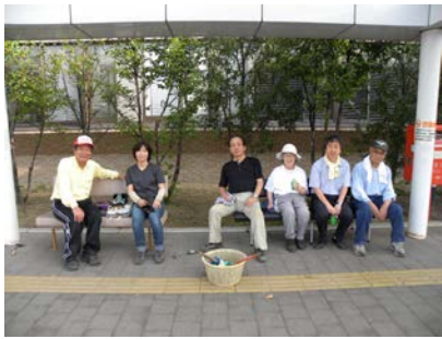
↑草取り作業の後の一服

♡ありがとうございました。大町総合病院にて定期的にCT検査を受けたことにより動脈瘤を見つけていただき信大病院にて恐る恐る手術を福井先生ほかスタッフの先生方の力を貸していただき適切な処置をしてくださり一命を助けていただきまことにありがとうございました。残された人生これからは自ら健康に気遣い生活をしてゆきます。ありがとうございました。(74歳男)