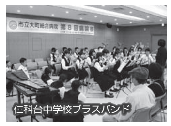
仁科台中学校ブラスバンド