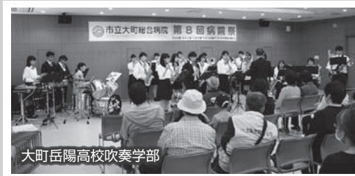
大町岳陽高校吹奏学部

病院祭は、地域とともに歩む病院として、多くの皆様に市立大町総合病院を広く知っていただくために開催しています。当日は天気に恵まれ、大勢の皆様にご来場いただきました。