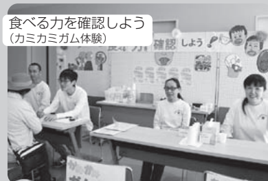
食べる力を確認しよう (カミカミガム体験)