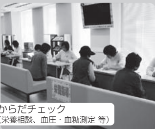
からだチェック (栄養相談、血圧・血糖測定等)