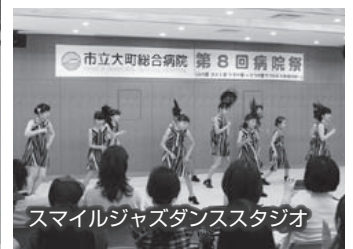
スマイルジャズダンススタジオ

平成30年5月20日(日)に「ふれ愛 ささえ愛 たすけ愛 3つの愛でつながる地域の絆」をテーマに第8回病院祭を開催しました。