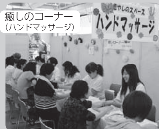
癒しのコーナー (ハンドマッサージ)